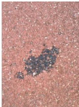
Remarque Etat dentretien et hygiène apparente du sol ( NS )