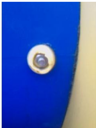
Remarque Présence de caches ( NS )