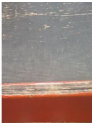
Remarque Peinture ou vernis ( NS )