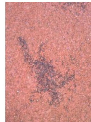
Remarque Etat dentretien et hygiène apparente du sol ( NS )